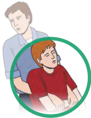
Person ggf. aus dem Gefahrenbereich retten